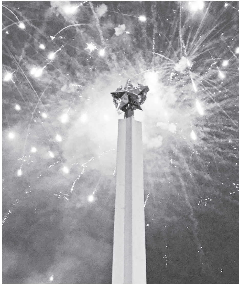
Ульяновск отметил присвоение почетного звания торжественным салютом на площади 30-летия Победы в тот же день - 2 июля.

«Мы отработали с тарифным органом поручение губернатора по минимизации